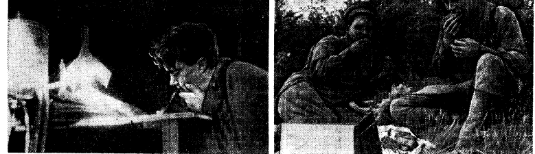
Б. Полевой в землянке в Сталинграде (1942 г.) А. Сурков и К. Симонов на Волховском фронте (1943 г.)