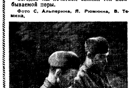
М. Шолохов и Е. Петров на Западном фронте (1941 г.)